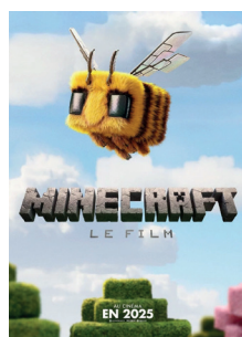
A MINECRAFT MOVIE