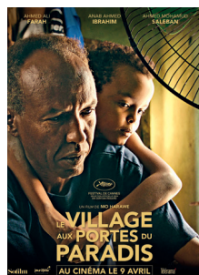
LE VILLAGE AUX PORTES DU PARADIS

POUR LE CONFORT ET LA TRANQUILLITÉ DE TOUS, L'ENTRÉE DANS LA SALLE NE SERA PLUS AUTORISÉE 10 MINUTES APRÈS LE DÉBUT DE LA SÉANCE.