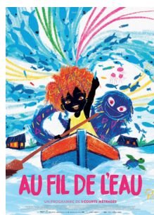
AU FIL DE L'EAU