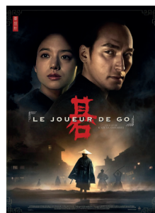
LE JOUEUR DE GO